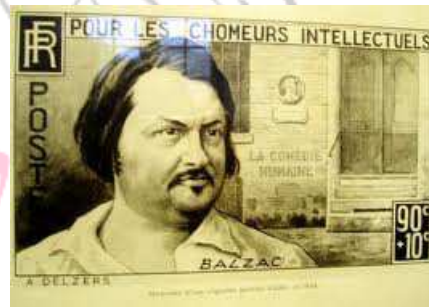
Bollo con Balzac