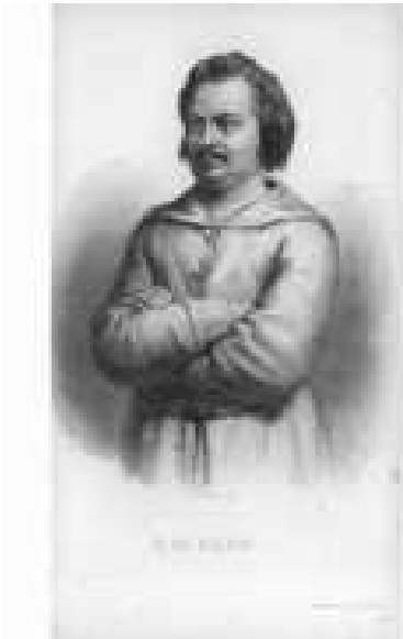
Balzac con l'”alba” Martinista