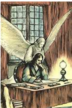
L'”angelo” di Balzac