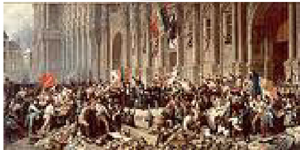
La rivoluzione a Parigi nel 1848. Gli scontri a Notre Dame

il liberale del papato le costò la messa al bando . George Sand è inoltre ricordata anche per il suo anticonformismo e per le relazioni sentimentali avute con lo scrittore Alfred de Musset e con il musicista Fryderyk Chopin.